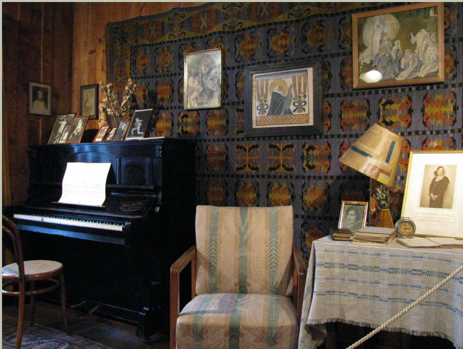
Pokój Karola Szymanowskiego - zabytkowe wnętrze z epoki