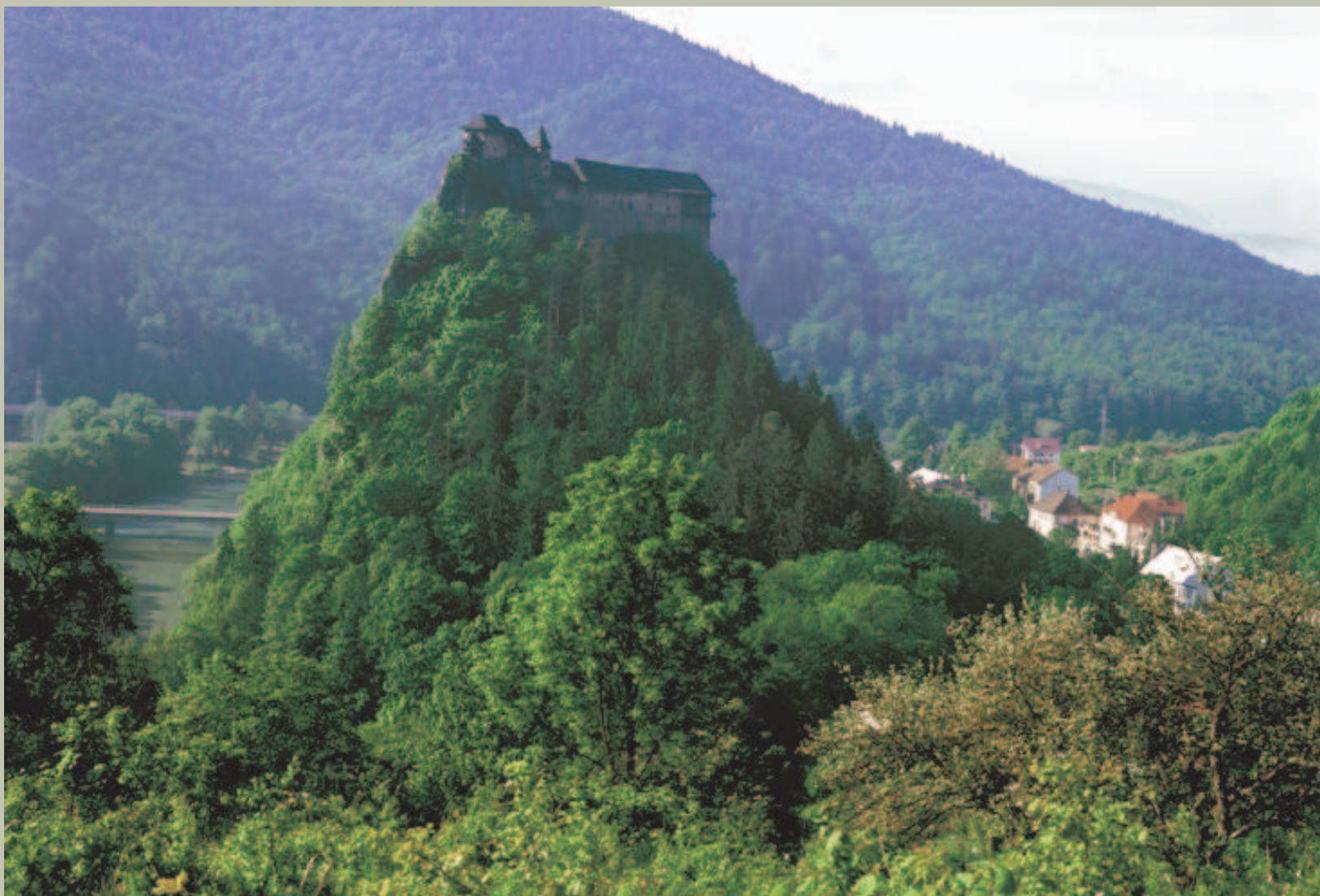
Zamek Orawski – dziedzictwo kulturowe Orawy