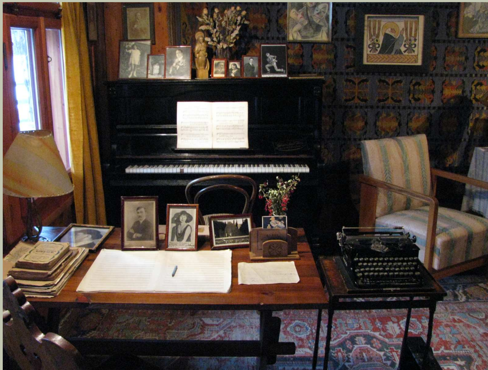
Pokój Karola Szymanowskiego w willi Atma