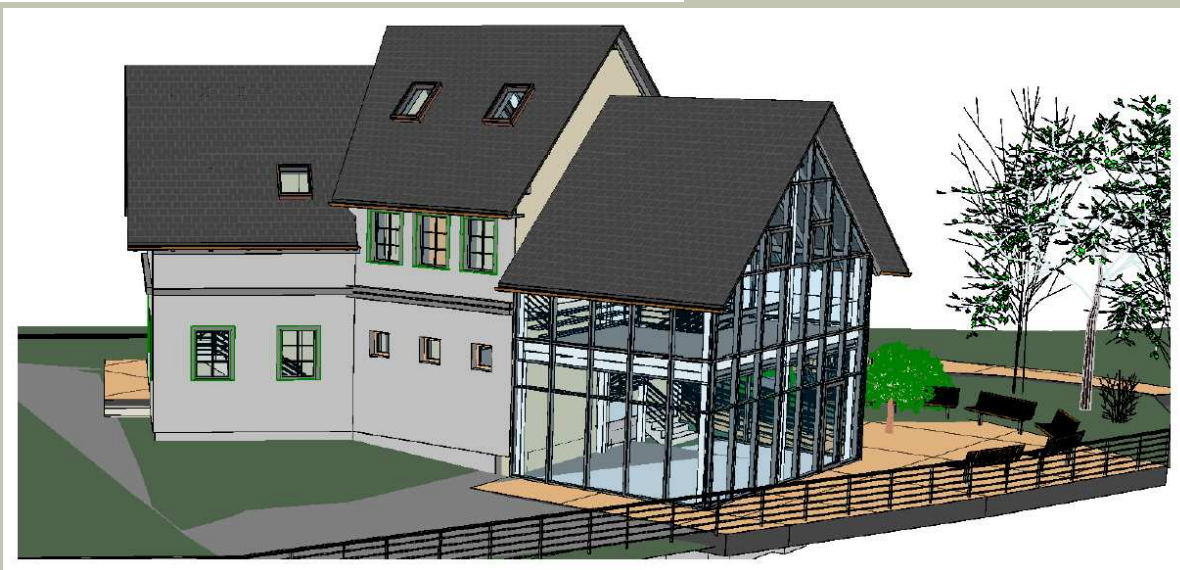
Projekt Centrum Informacji Turystycznej