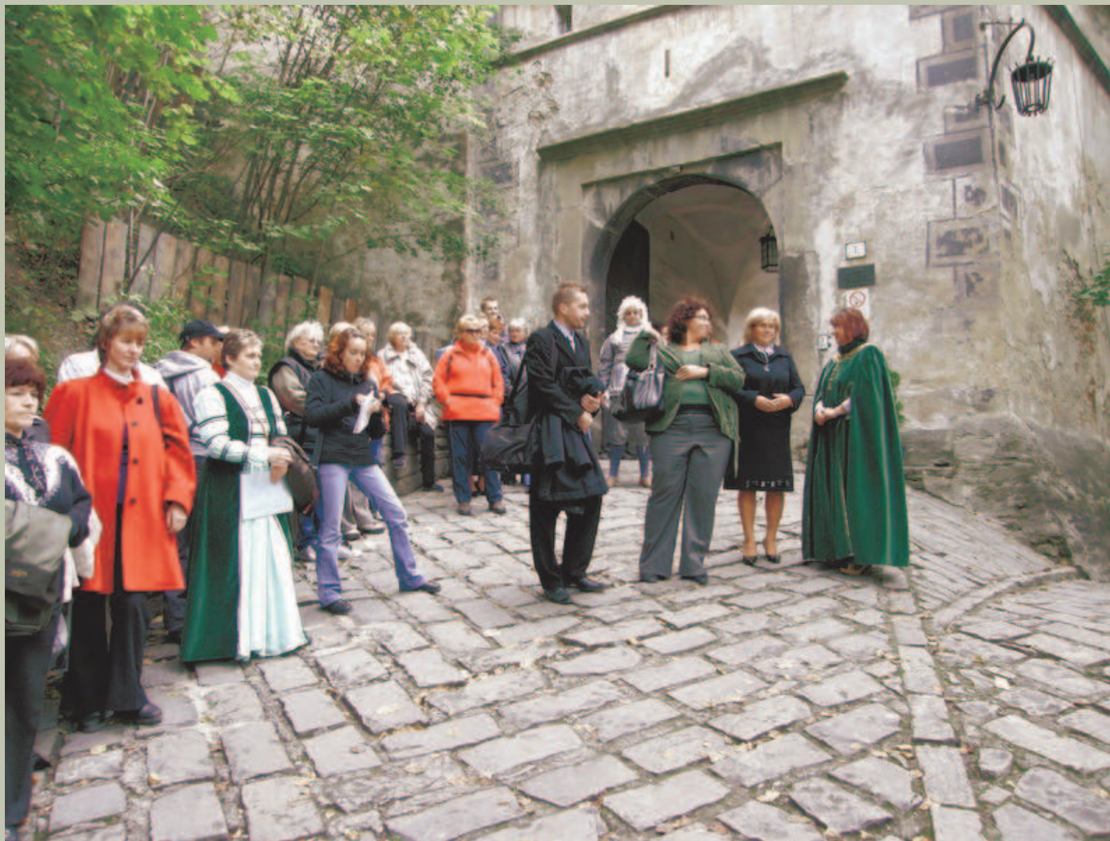
Wejście do Zamku Orawskiego