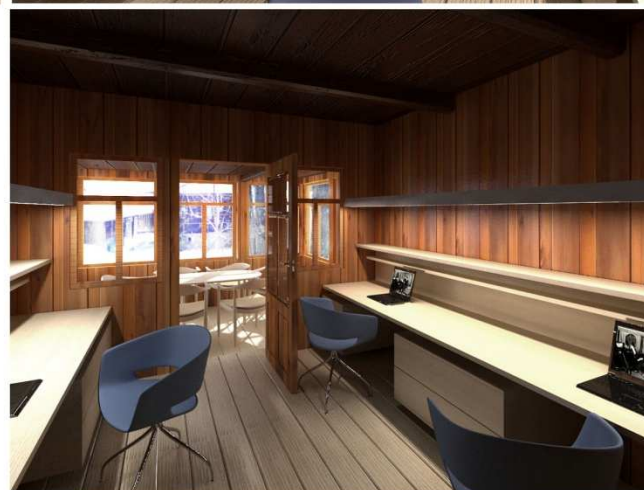
Projekt modernizacji pomieszczeń biurowych