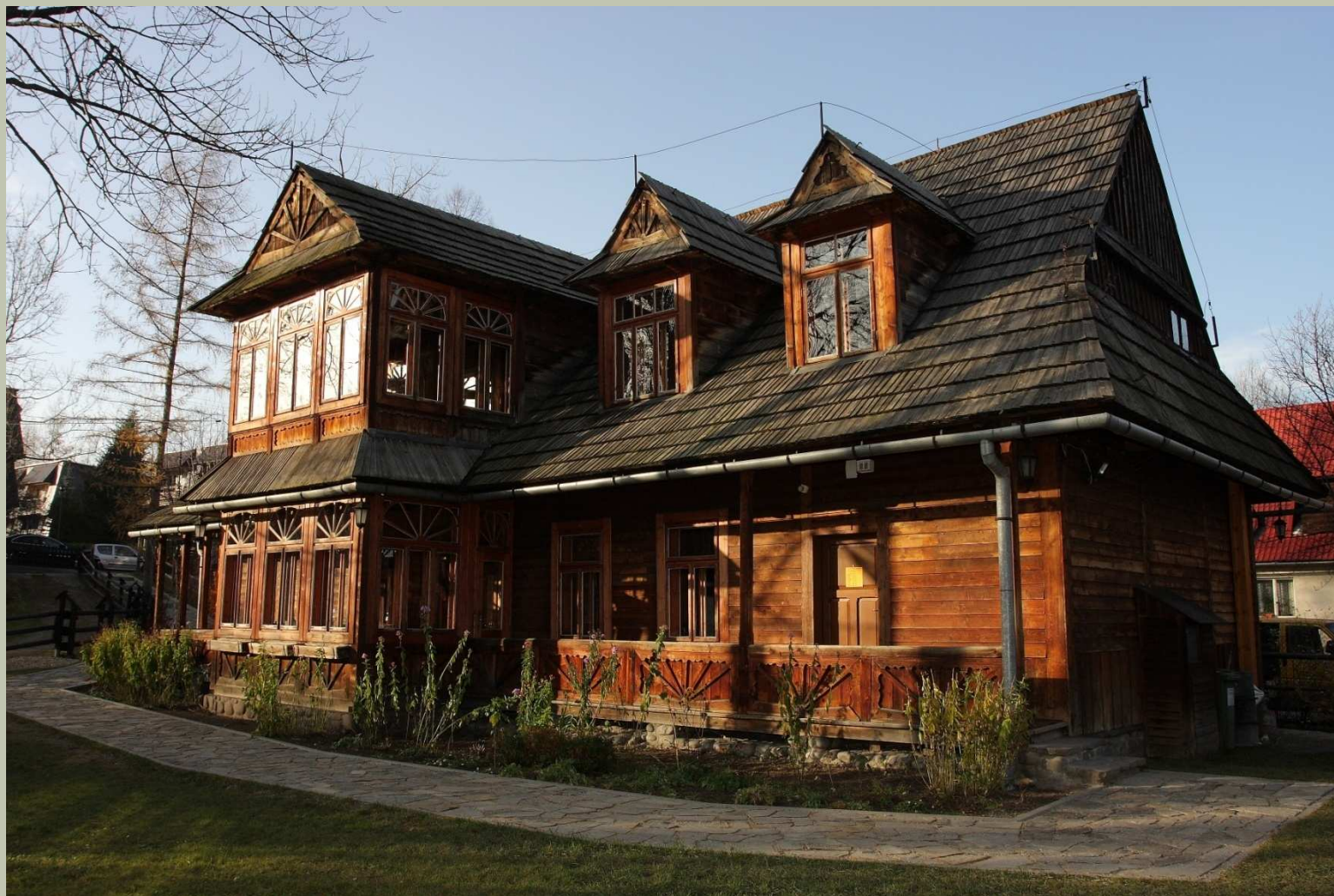
Muzeum Karola Szymanowskiego w willi Atma w Zakopanem