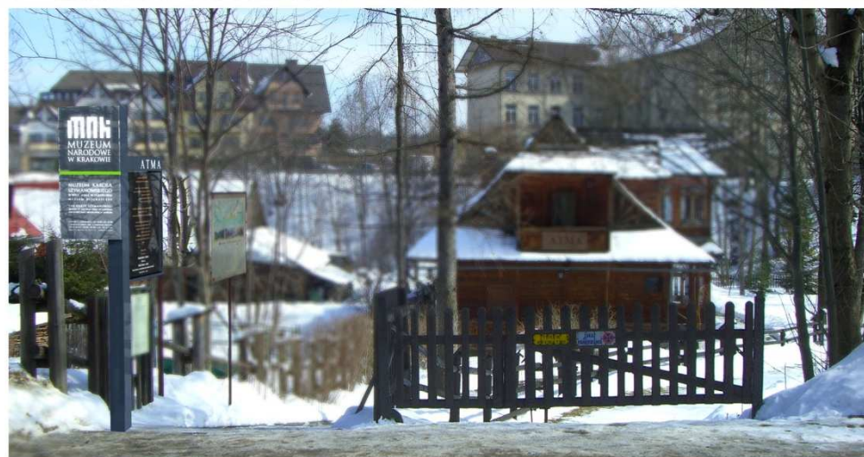
Projekt modernizacji oświetlenia i oznakowania willi Atma