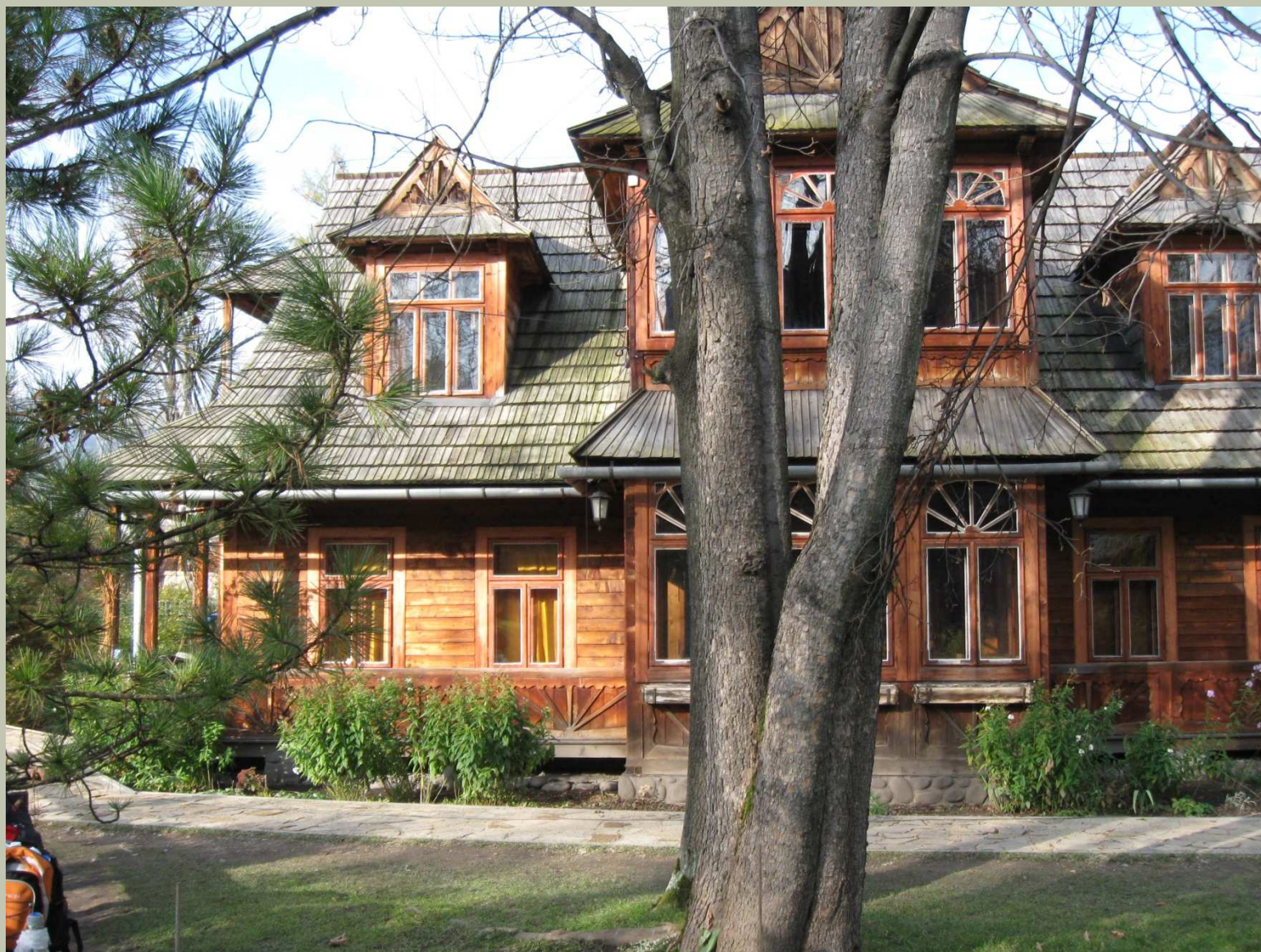
Willa Atma – zabytkowa architektura drewniana