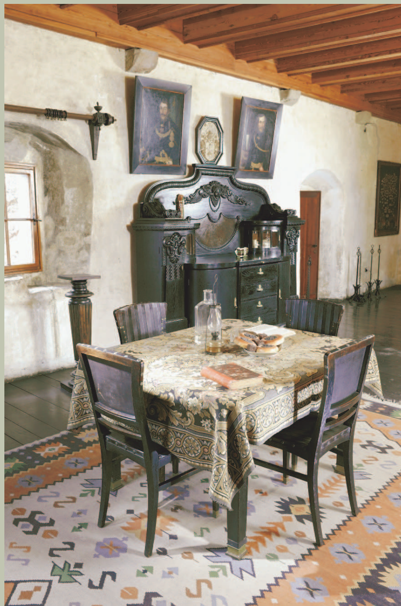
Zabytkowe wnętrze w Zamku Orawskim