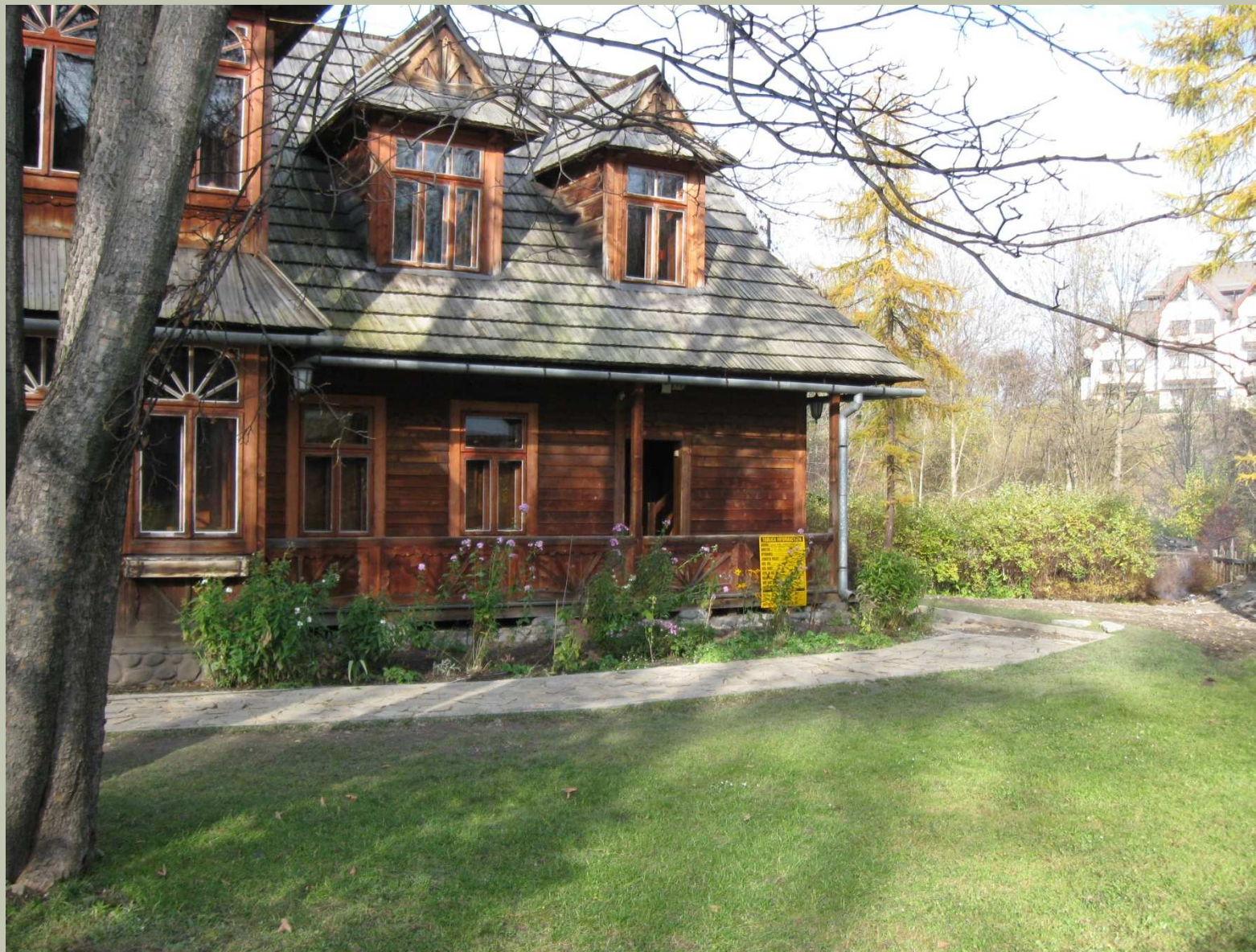
Willa Atma - widok od werandy