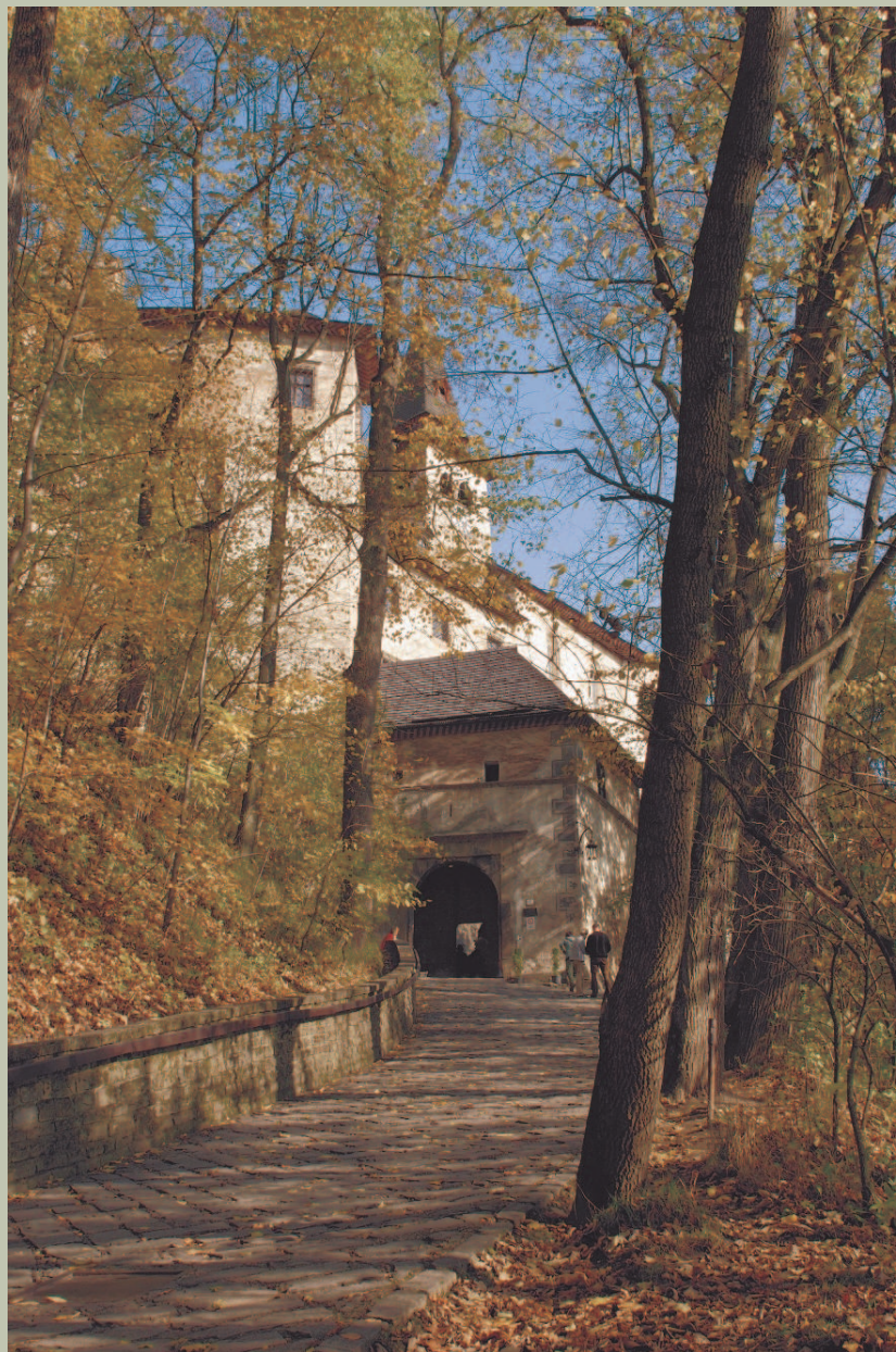
Droga do Zamku Orawskiego