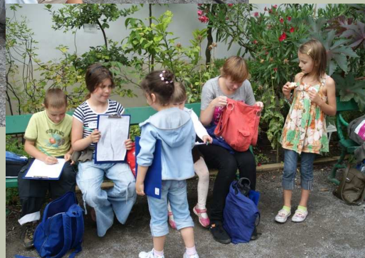
Warsztaty dla dzieci