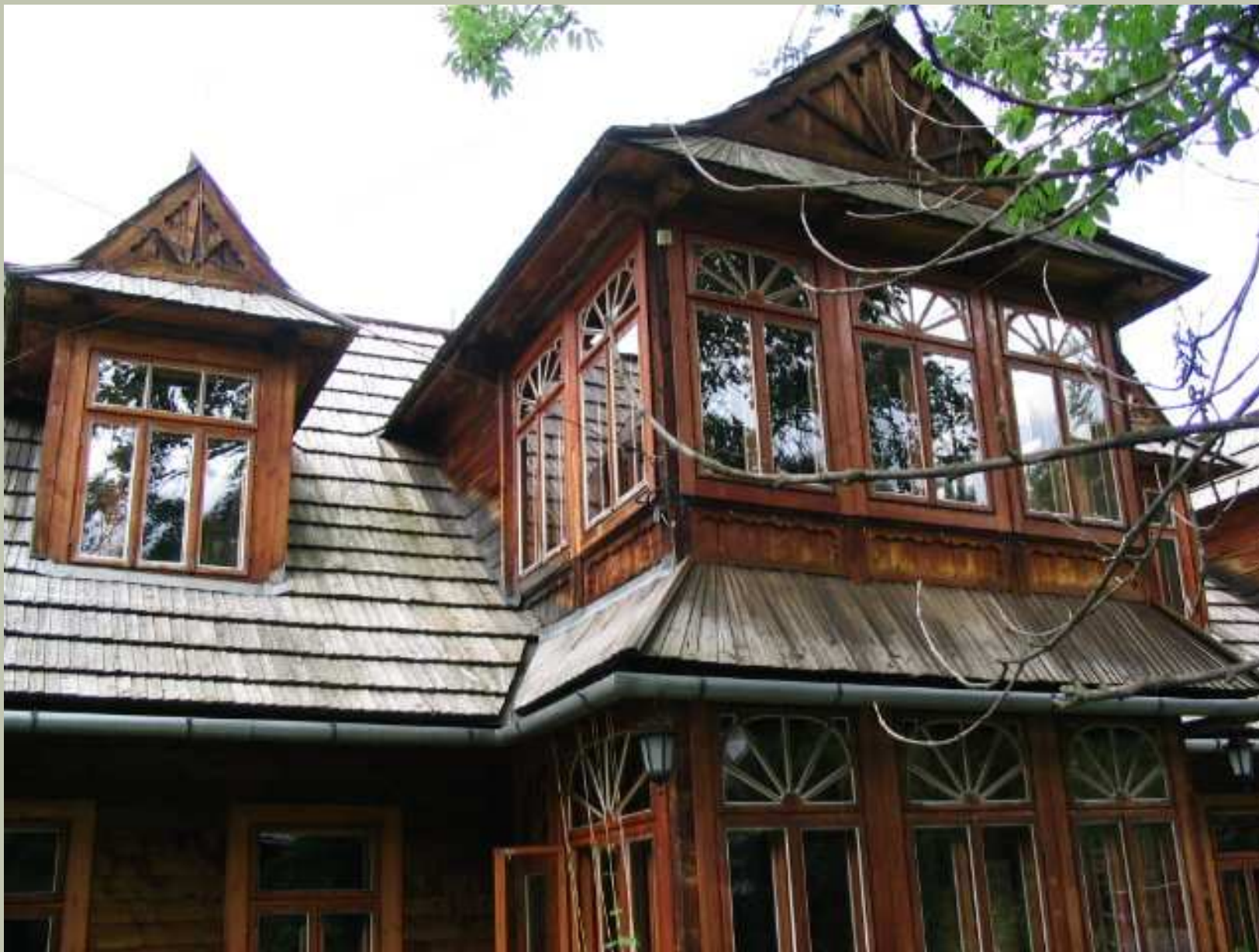
Willa Atma – przykład stylu zakopiańskiego w architekturze