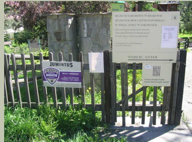
Aktualne oznakowanie przed willą Atma