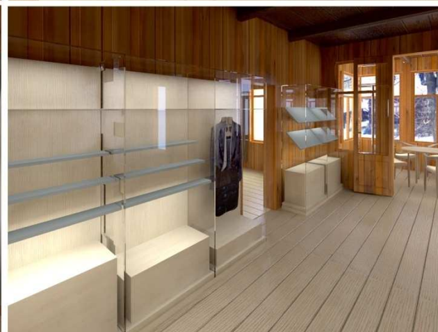
Projekt modernizacji wnętrza Muzeum Karola Szymanowskiego w willi Atma z salą koncertową i studium do słuchania muzyki