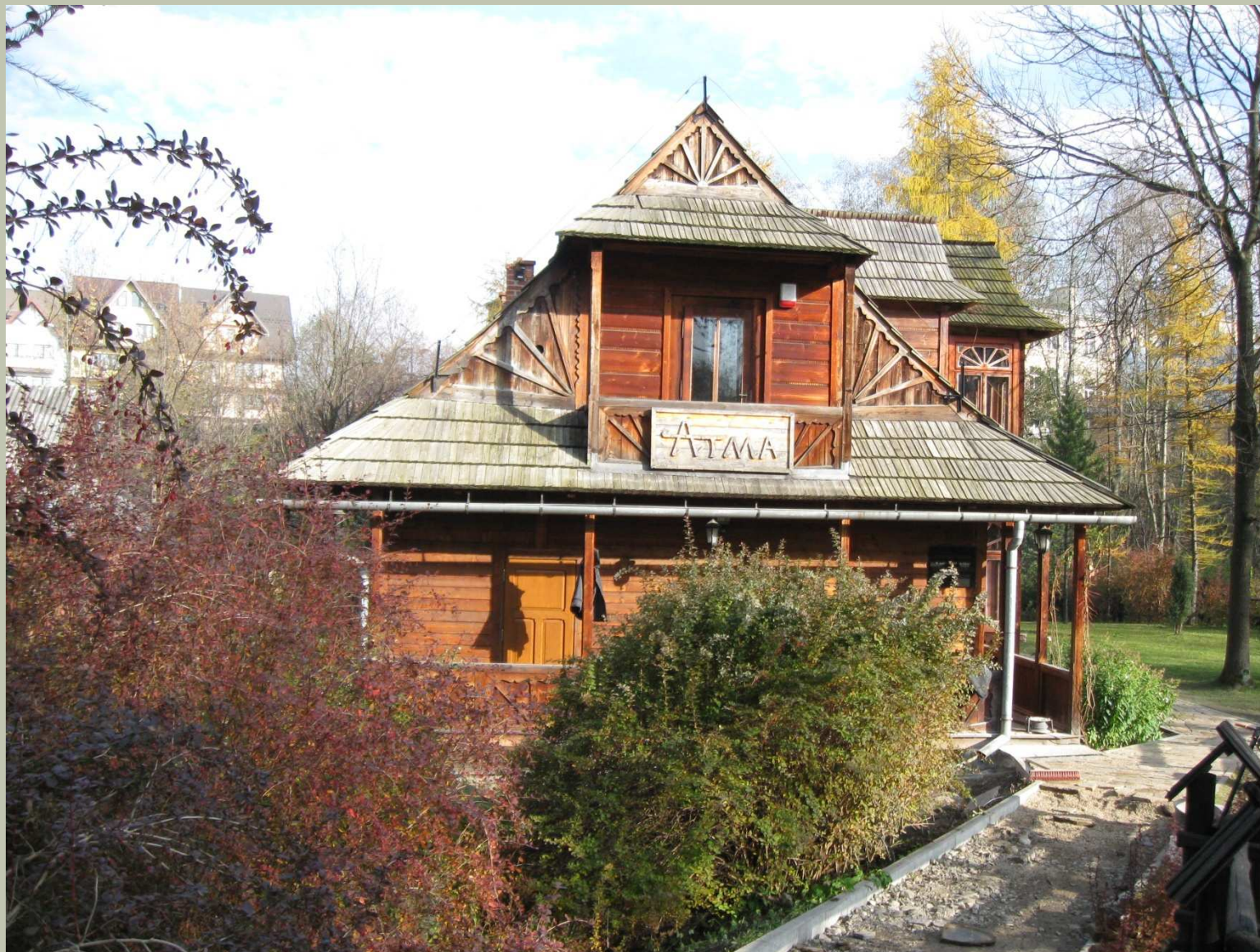
Otoczenie willi Atma