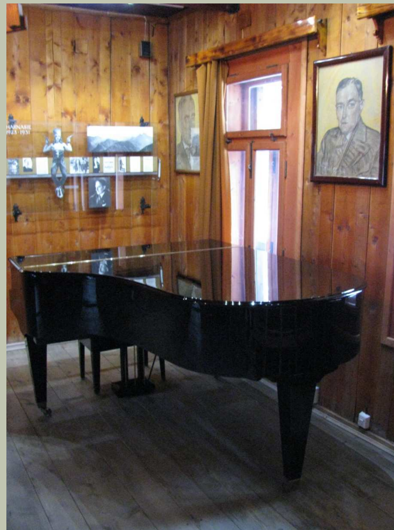
Pamiętki po Karolu Szymanowskim w willi Atma