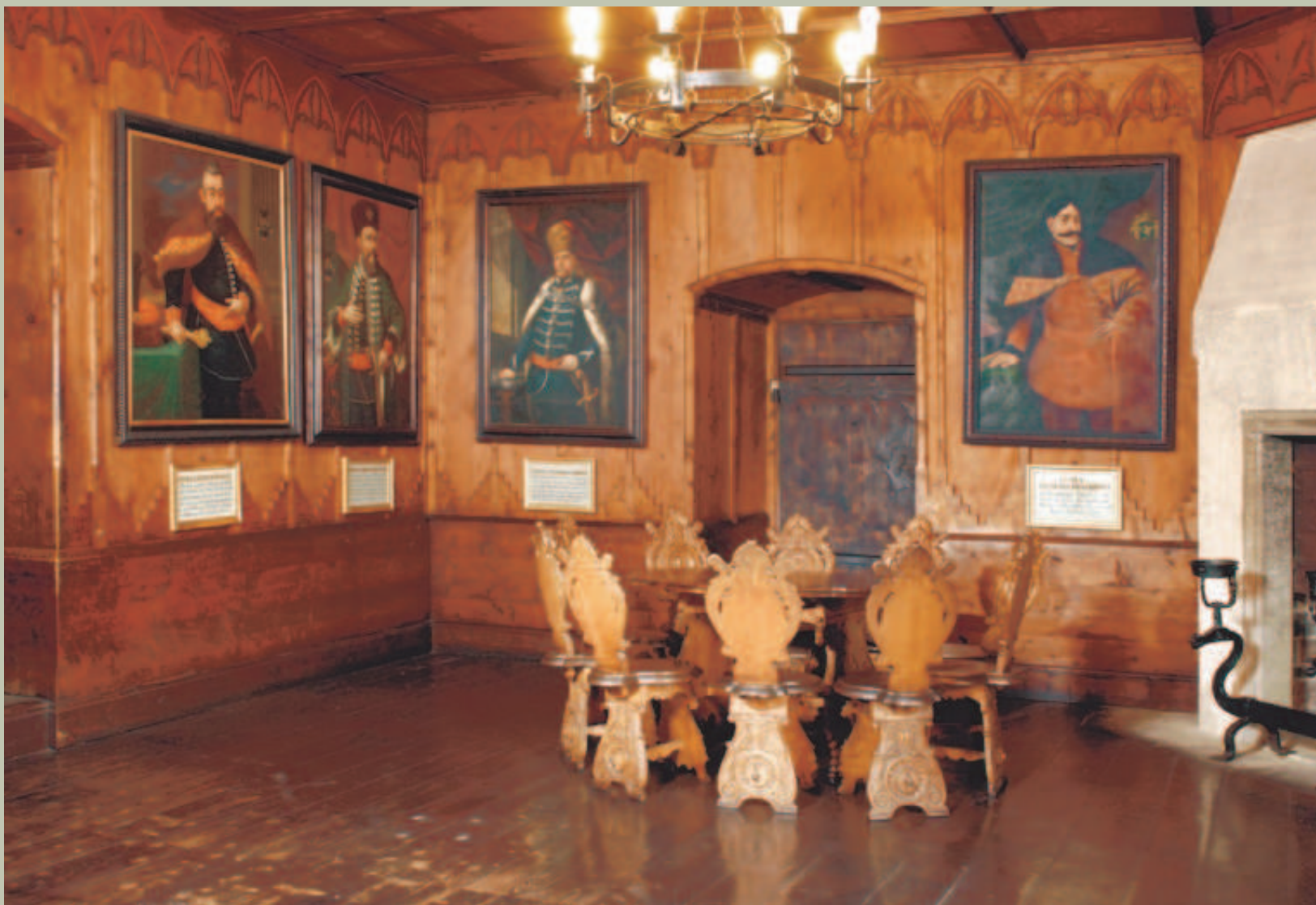
Wnętrze Zamku Orawskiego