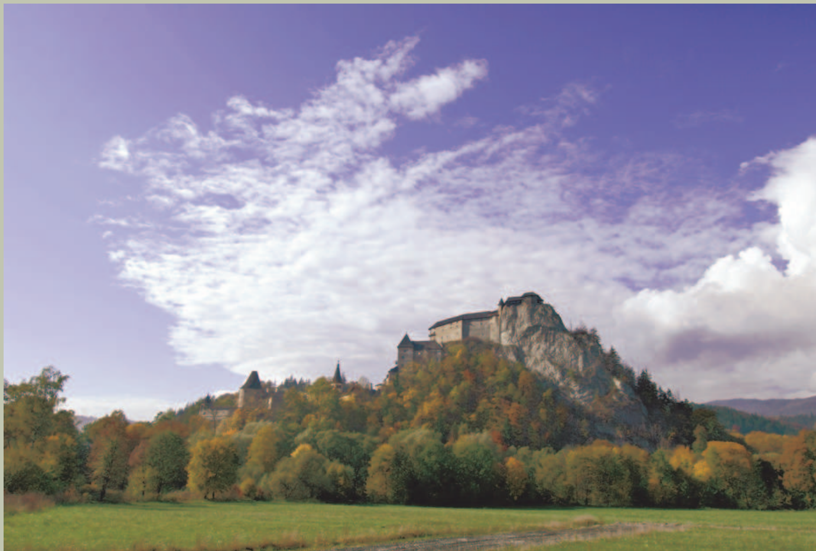
Zamek Orawski – turystyczna atrakcja Orawy