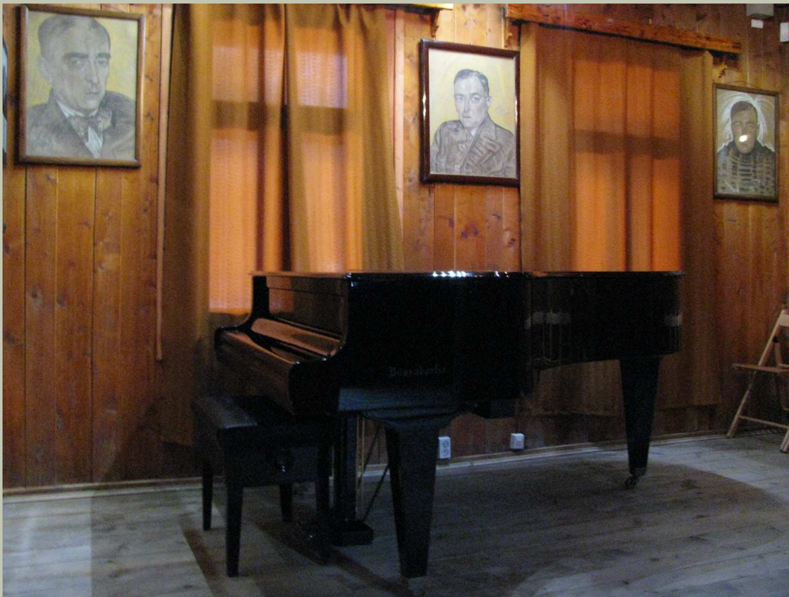
Sala koncertowa w Muzeum Karola Szymanowskiego w willi Atma w Zakopanem