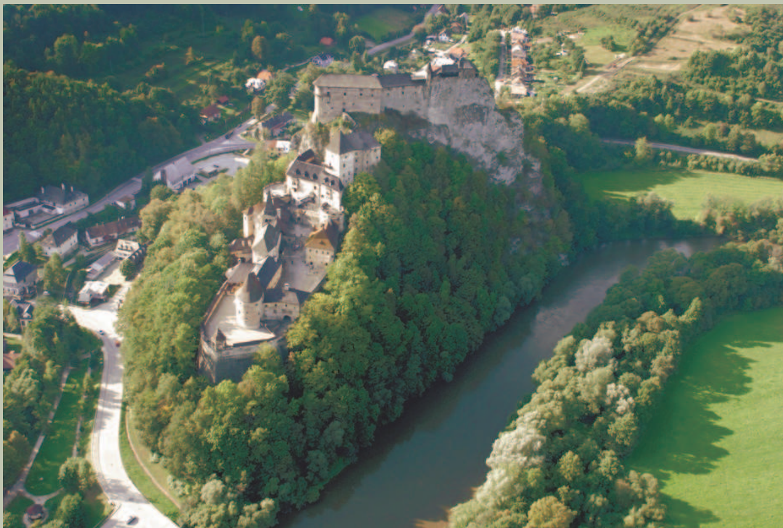
Zamek Orawski z lotu ptaka