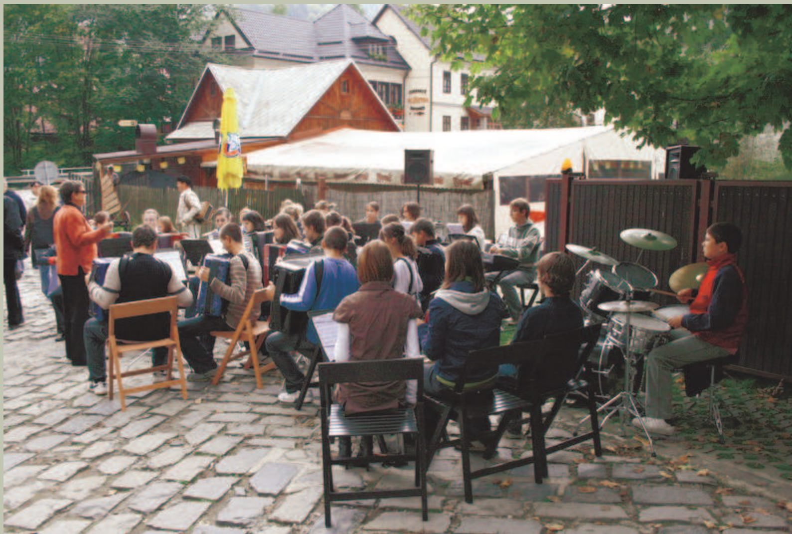
Warsztaty muzyczne, Zamek Orawski