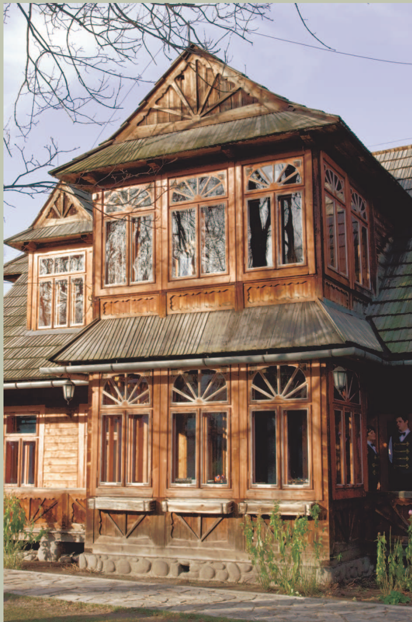
Muzeum Karola Szymanowskiego w willi Atma w Zakopanem