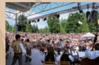
Plné hľadisko počas festivalových dní Pełna widownia podczas festiwalowych dni