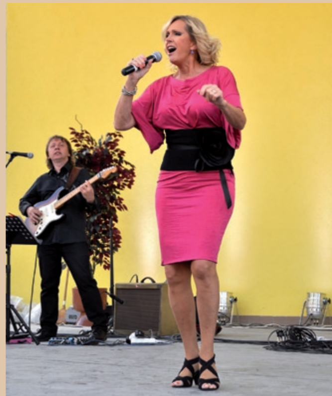
Vystúpenie Heleny Vondráčkovej Występ Heleny Vondráčkovej