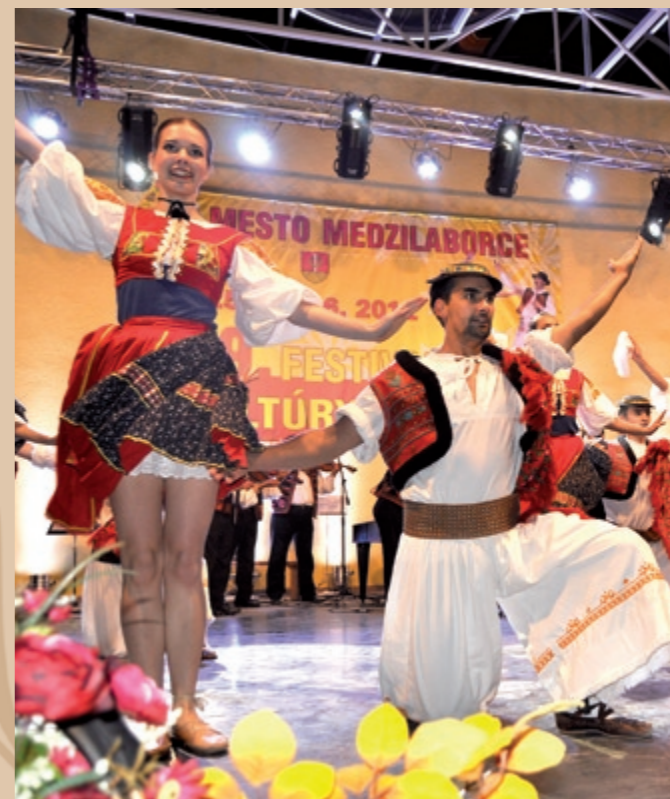
Folklórny súbor Čarovné ostrohy Zespół folklorystyczny Cudowne Ostrogi (Čarovné ostrohy)