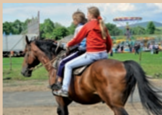
Kone ako súčasť zábavy pre deti Konie będące składnikiem zabawy dla dzieci