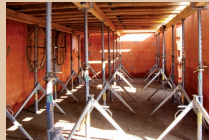
Debnenie pod železobetónovým monolitickým stropom na prvom nadzemnom poschodí v objekte budovanom zariadení amfiteátra