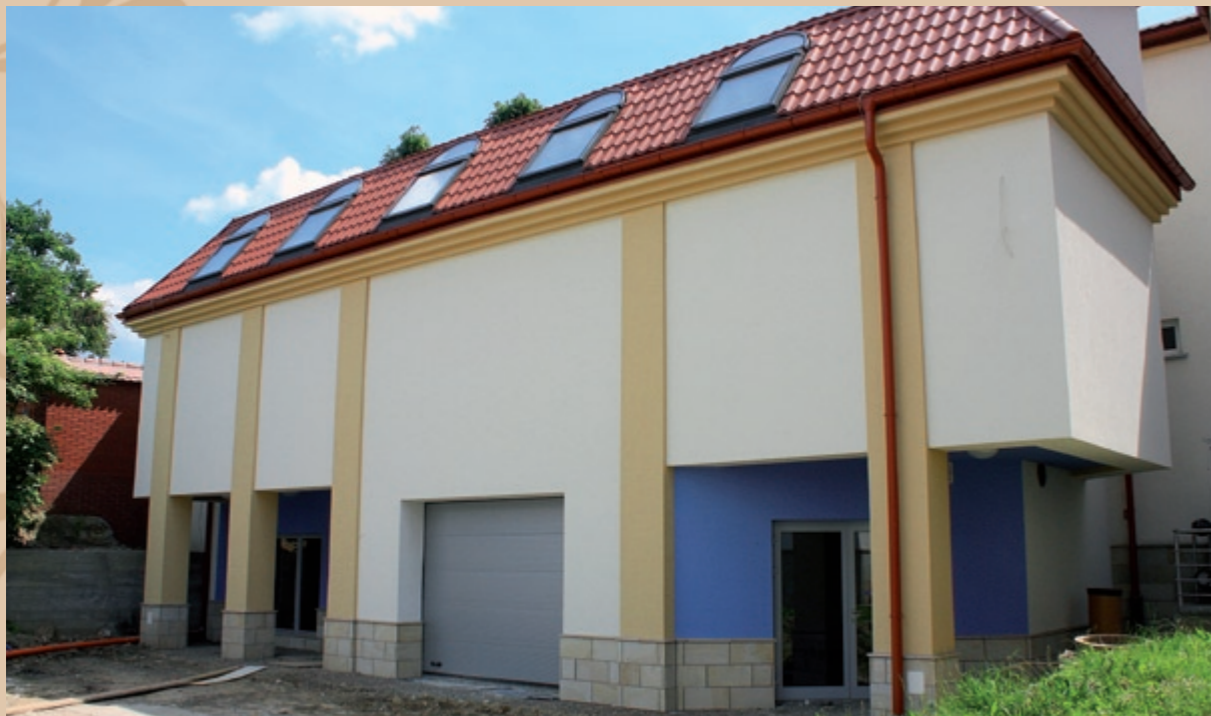
Tanečná sála – pohľad od vchodu Sala tańca – widok od strony wejścia