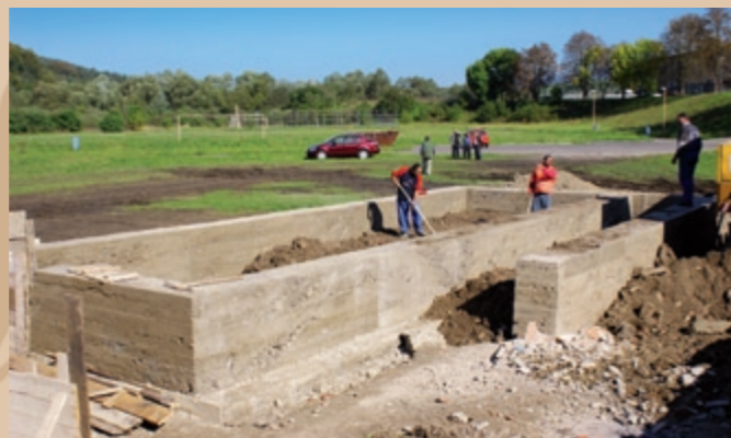
Budovanie základových pásov z čistého betónu pod nosnými stenami objektu zázemia amfiteátra

wierzchnie, oświetlenie publiczne, dopasowanie istniejących przewodów elektrycznych, nagłośnienie i oświetlenie sceny i remont widowni. Główną budowę przedstawia zaplecze amfiteatru. Chodzi o dwupiętrowy budynek, bezpośrednio połączony ze sceną, gdzie znajdują się szatnie z urządzeniami socjalnymi i inne pomieszczenia dla występujących i organizatorów. Objekt, podłączony do sieci inżynierskich (elektryczność, woda, kanalizacja) ma murowane zewnętrzne ściany, wykonane z kształtówek o grubości 450 mm, sufit jest monolityczny, żelbetonowy, łukowy drewniany dach pokryty jest pasami bitumicznymi, zewnętrzne drzwi i okna są plastikowe, do podłóg wykorzystano głównie ceramikę, elewacje są od strony zewnętrznej wykonane krzemianowym tynkiem koloru jasnoniebieskiego. Ponad sceną znajduje się również nowe zadaszenie – chodzi o konstrukcję stalową, nakrytą lexanem.