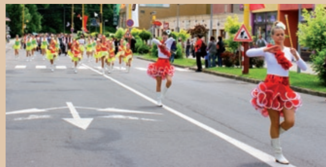
Krojovaný sprievod, v popredí mažoretky Diridonky z Prešova Marsz w strojach ludowych, pierwsze mažoretki Diridonki z Preszowa