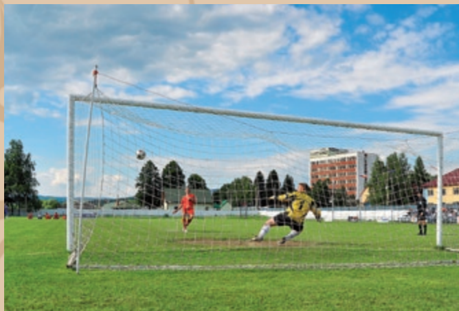
Futbalové zápasy v rámci športovej časti festivalu Miecze w piłce nożnej w ramach sportowej części festiwalu