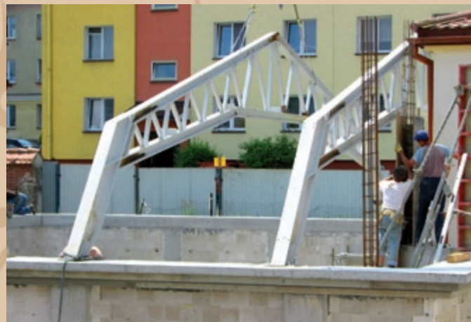
Montáž strechy Montáž dachu

Vybavenie sály elektroakustickým zariadením spolu s odporúčaným vybavením, nutným pre vyučovanie tanca, možno z technického i ekonomického hľadiska považovať za zodpovedajúce súčasným štandardom a optimálne pre takýto typ objektu.