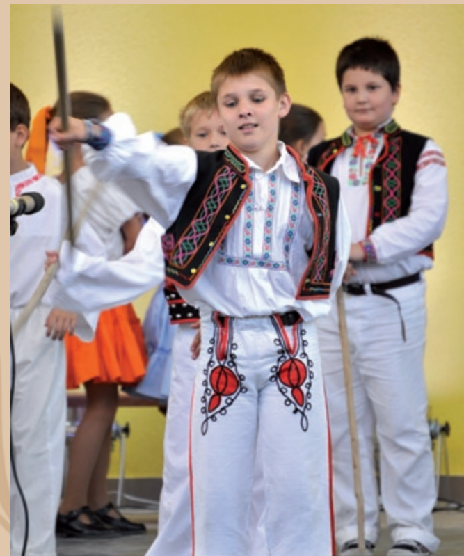
Folklorný súbor Chemloňáčik z Humenného Zespół folklorystyczny Chemloniaczek (Chemloňáčik) z Humennego