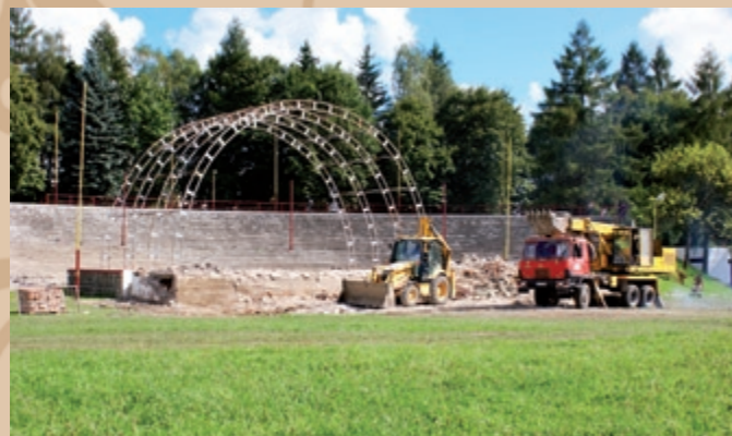
Búracie práce na pôvodnej stavbe šatní a na zastrešení javiska

chy, verejné osvetlenie, úprava jestvujúcich elektrických rozvodov, ozvučenie a osvetlenie javiska a úprava sedenia v amfiteátri. Hlavnú stavbu predstavuje zázemie amfiteátra. Ide o dvojpodlažnú budovu, priamo prepojenú s javiskom, kde sa nachádzajú šatne so sociálnym zariadením a iné miestnosti pre účinkujúcich i organizátorov. Objekt, napojený na inžinierske siete (elektrina, voda, kanalizácia), má murované obvodové steny, zhotovené z tvárníc s hrúbkou 450 mm, strop je monolitický, železobetónový, oblúčková drevená strecha má krytinu z asfaltových pásov, vonkajšie dvere a okná sú plastové, na podlahy bola použitá prevažne keramika, fasády sú z vonkajšej strany upravené silikátovou omietkou svetlomodrej farby. Nad javiskom sa nachádza aj nové zastrešenie – ide o ocelovú konštrukciu, pokrytú lexanom.