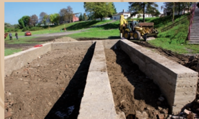
Budowa fundamentowych pasów z czystego betonu pod nośnymi ścianami zaplecza amfiteatru