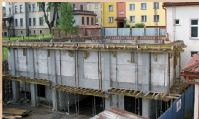
Realizácia stien Wykonanie ścian

Prijaté technické riešenia sú najoptimálnejšie z hľadiska správnej realizácie projektu, čo je podmienené veľkosťou parcely, jej tvarom i susediacou zástavbou.