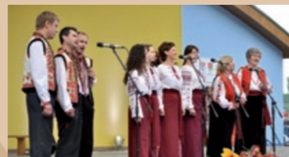
Folklorný súbor Červená ruža z Ukrajiny Zespół folklorystyczny Czerwona Ruža z Ukrainy