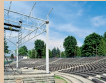
Widok na budowę zariadenia amfiteátra i konstrukcję stalową ponad sceną przed robotami zakończeniowymi