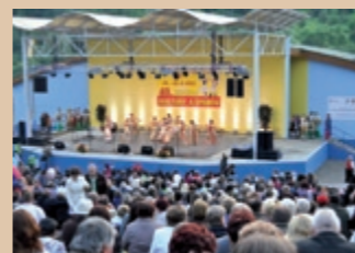
Večerný program festivalu Wieczorowy program festiwalu