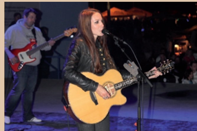
Z vystúpenia Zuzany Smatanovej Z występu Zuzany Smatanovej