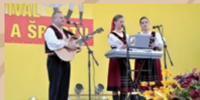
Trio Magurových z Humenného Trio Magurowych z Humennego