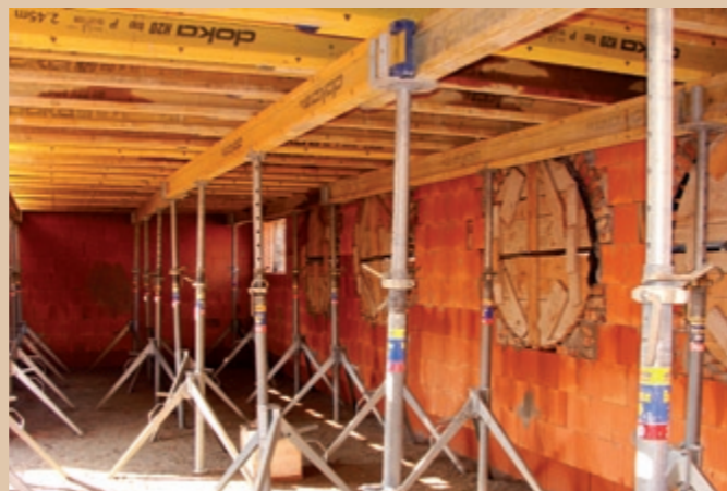
Debnenie pod železobetónovým monolitickým stropom na prvom nadzemnom podlaží v stavebnom objekte zázemia amfiteátra