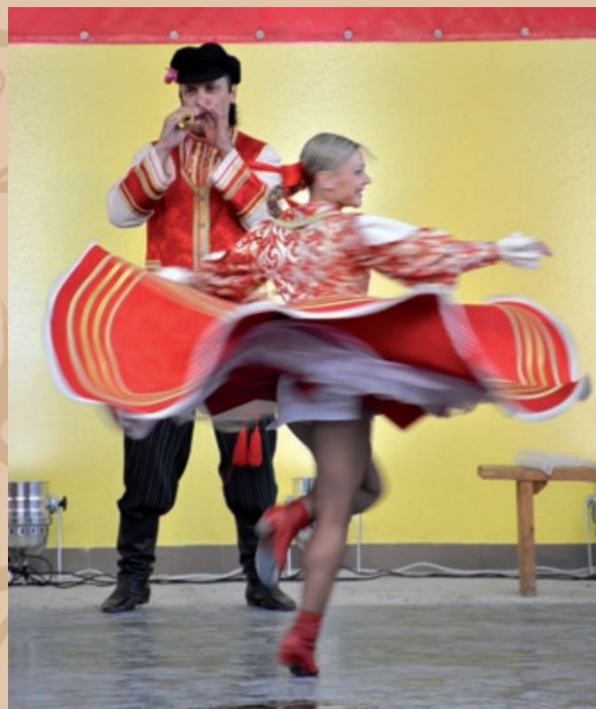
Tanečný súbor z ukrajinskej Vologdy Zespół taneczny z ukraińskiej Wologdy