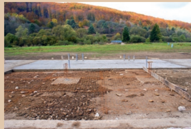
Betón fundamentový o hrúbke 100 mm, uzbrojený sieťou, pod podlahou prvého nadzemného poschodia zariadenia amfiteátra