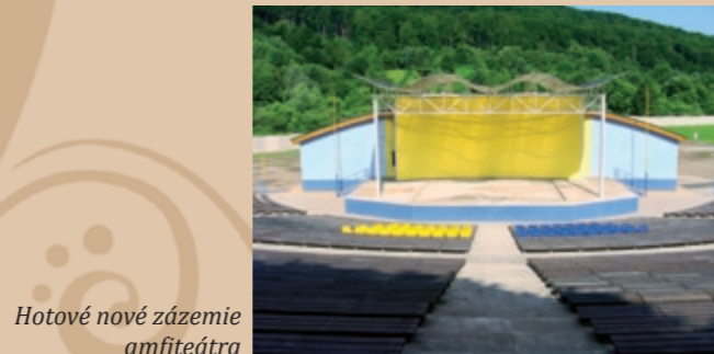
Hotové nové zázemie amfiteátra