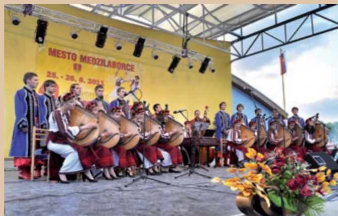
Banduristi z Ukrajny Bandurzyści z Ukrainy