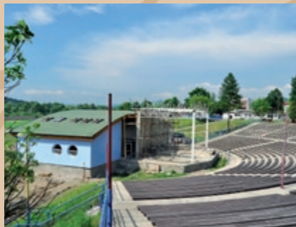
Pohľad na budovu zázemia amfiteátra a oceľovú konštrukciu nad javiskom pred dokončovacími prácami