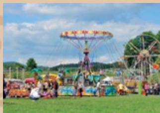
Retiazkový kolotoč Karuzela łańcuchowa