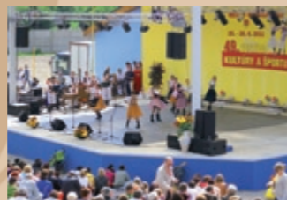
Folklórny súbor Čarnica z Kośc Zespół folklorystyczny Čarnica z Koszyc