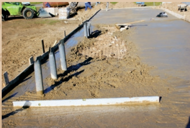
Podkladový betón s hrúbkou 100 mm, vystužený sieťovinou, pod podlahou prvého nadzemného podlažia zázemia amfiteátra