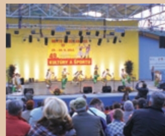
Tanečný súbor Dúha z Ukrajiny Zespół taneczny Tęcza z Ukrainy