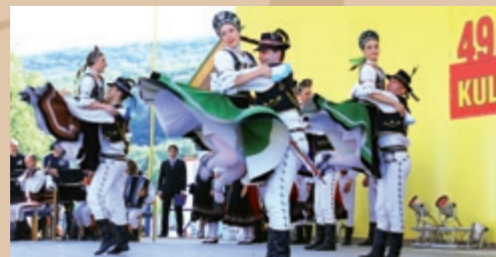
Poddukelský umelecký ľudový súbor (PULS) z Prešova Poddukelski Artystyczny Zespół Ludowy (PULS) z Przeszowa