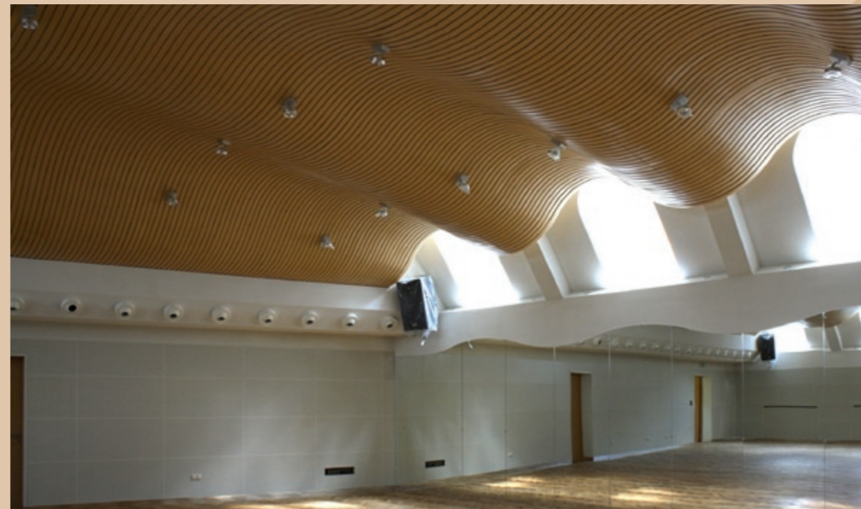
Vnútro tanečnej sály Wnętrze Sali tańca