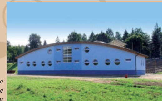
Gotowe nowe zariadenie amfiteátra