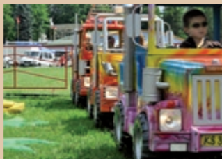
Kolotoč pre najmenších Karuzela dla najmniejszych