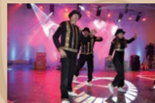
Tanečná skupina Old School Brothers Grupa taneczna Old School Brothers