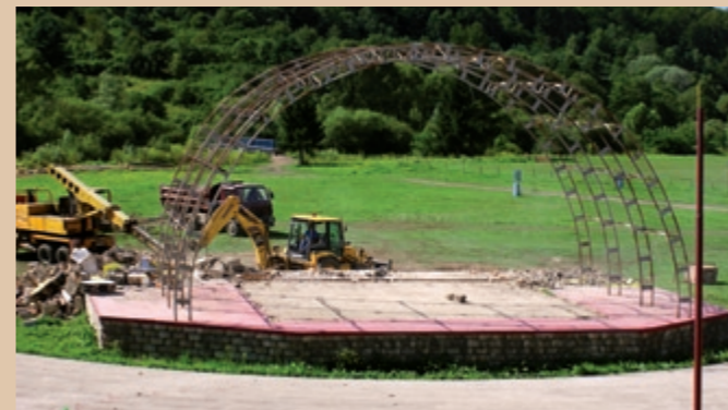
Roboty burzące na pierwotnym budynku szatni i na zadaszaniu sceny

wierzchnie, oświetlenie publiczne, dopasowanie istniejących przewodów elektrycznych, nagłośnienie i oświetlenie sceny i remont widowni. Główną budowę przedstawia zaplecze amfiteatru. Chodzi o dwupiętrowy budynek, bezpośrednio połączony ze sceną, gdzie znajdują się szatnie z urządzeniami socjalnymi i inne pomieszczenia dla występujących i organizatorów. Objekt, podłączony do sieci inżynierskich (elektryczność, woda, kanalizacja) ma murowane zewnętrzne ściany, wykonane z kształtówek o grubości 450 mm, sufit jest monolityczny, żelbetonowy, łukowy drewniany dach pokryty jest pasami bitumicznymi, zewnętrzne drzwi i okna są plastikowe, do podłóg wykorzystano głównie ceramikę, elewacje są od strony zewnętrznej wykonane krzemianowym tynkiem koloru jasnoniebieskiego. Ponad sceną znajduje się również nowe zadaszenie – chodzi o konstrukcję stalową, nakrytą lexanem.