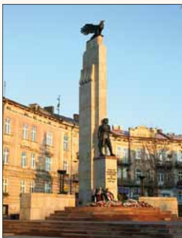
Pomnik Orłąt Przemyskich

Z placu Orłąt Przemyskich przechodzimy na znajdujący się po prawej sąsiedni plac Konstytucji 3 Maja. Po jego prawej stronie zobaczymy założone w XVII wieku opactwo benedyktynek , najstarszy zabytek Zasania. Po zniszczeniach w wyniku najazdów