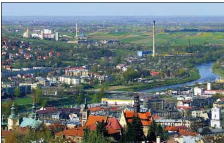
Widok ze Zniesienia

Wychodzimy na kulminację Zniesienia (353 m n.p.m.), którego nazwa wywodzi się według starych przekazów od pokonania „zniesienia” w tym miejscu atakujących Przemysław Tatarów. Zniesienie jest najdalej wysuniętą na wschód częścią Pogórza Przemyskiego i całych Karpat Zachodnich. Przed nami maszt wieży telewizyjnej z 1962 roku.