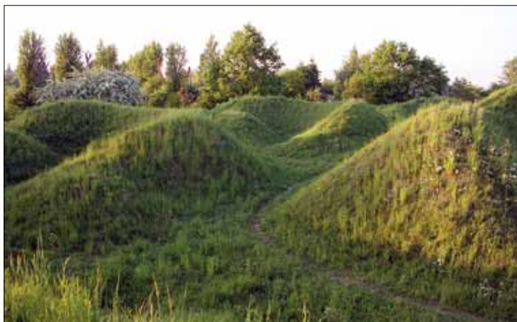
Fragment fortu XIX „Winna Góra”

florystyczny „Jamy” ze stanowiskiem rzadkiego w naszym kraju lnu austriackiego.